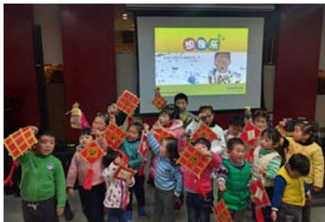
设计属于你的中国结

踏入五楼展厅，一幅幅充满春节色彩的楹联将展览厅映衬得格外喜庆。楹联是中华民族迎农历新年特有的传统文化，是集民俗文化、吉祥如意、文学创作和书法艺术于一体的艺术样式，包含着我们对美好生活的寄望和祝福。本次“同筑中国梦共度书香年”楹联文化展由国家图书馆主办，中国图书馆学会协办、宝山区图书馆承办，展览时间从1月29日持续至2月22日，为期21天。此次展览以赏析传统佳联与展示反映当代小康生活创作联为主，介绍了楹联起源、特点和文化内涵，共分楹联概述、楹联的分类、楹联的形式以及楹联的创作四个单元。