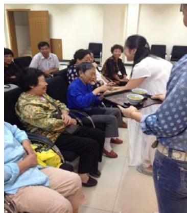
(月浦镇图书馆供稿)

不少前来参加讲座的居民纷纷表示：以茶为媒，通过识茶、赏茶、饮茶来修身养性、陶冶情操，可以增进友谊、学习礼仪、品味人生。通过举办此次活动使广大读者认识了茶文化，有助于陶冶情操、去除杂念，加强内涵建设，最终促进精神的享受与人格的完善。