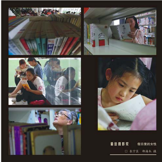
最佳摄影奖 假日里的女性 □ 长宁区