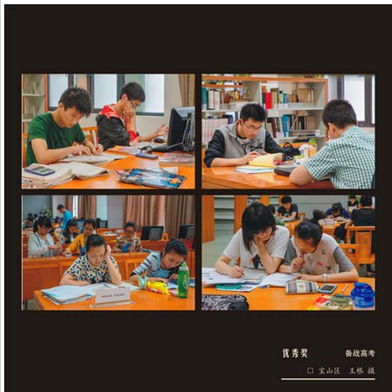
优秀奖 备战高考 □ 宝山区 王根 摄