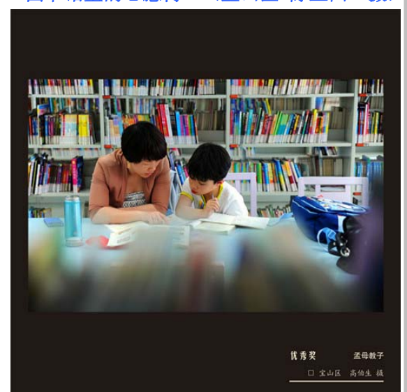
优秀奖 孟母教子 □ 宝山区