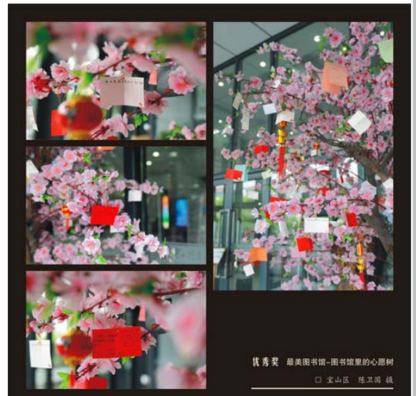
优秀奖 最美图书馆—图书馆里的心愿树