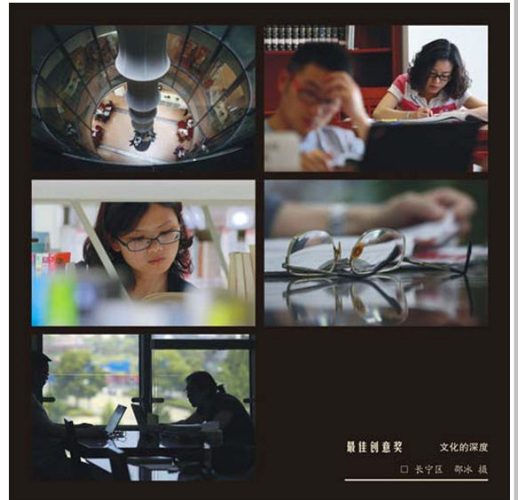
最佳创意奖 文化的深度 □ 长宁区 邵冰 摄