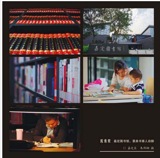
优秀奖 嘉定图书馆, 景美书香人自醉 □ 嘉定区 朱伟钢 摄