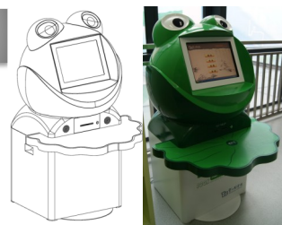
自助借还书机 (青蛙型)