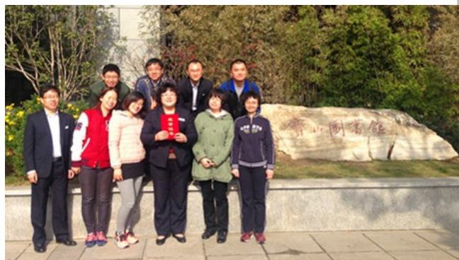
拔河冠军队奋力后的幸福合影！

经过一番较量，决战就在第一和第四组间展开。不愧是最终战，两队实力相差无几，一开打便呈胶着状态，角力不断。但两虎相遇必有一胜，高手之战，胜负只在分毫之间。虽然第四组竭尽全力，怎奈第一组更胜一筹，直落两局，最终将冠军笑纳怀中。