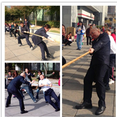
我拼，我拼，我拼拼拼！

最后的重磅戏拔河比赛在众人期待中终于上场。经过一番抽签，男女阵营判定对象各自结盟。第一场比试为第一组对阵第二组。第一组内有流通部两大主任坐镇，再联合一众男汉子女汉子足以笑傲全场。相对于第一组的人才济济，第二组则实力稍逊。果不其然，口令响起还不到半分钟，局势已分。第一组轻松拿下首盘。