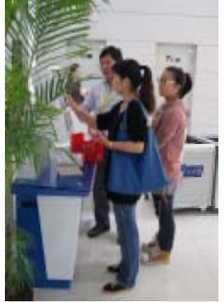
耐心指导读者使用自助设备

在新馆开馆前的志愿者培训会上，唐馆长动情地讲述着新馆的建设、验收、布置过程以及书籍的整理、保管及上架，带我们熟悉图书馆各楼层布局，兴致盎然地为我们介绍馆内现代化的一流设施、独具匠心的墙画、温馨感人的休息凳摆放、巧妙的电脑及网络走线布局、充满童趣的儿童馆布置等等。让我在感慨这些年宝图工作人员不为人知的艰辛与不易的同时，也强烈感受到了他们对宝图的热爱与付出。为自己能有机会为宝图服务，成为其中的一员而感到欣喜。