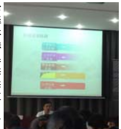
老师正在介绍网站的资源