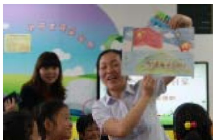
工作人员向大家展示小读者的作品