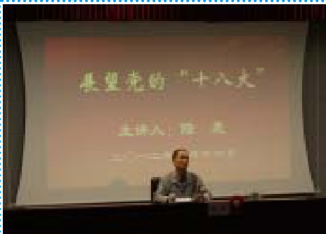
陆震教授在作精彩的报告

10月16日下午，宝山区各局、机关单位、社区党员以及读者160余人，在我馆五楼报告厅内共同听取了著名社会学家陆震教授为大家作的“展望党的‘十八大’”的形势报告。