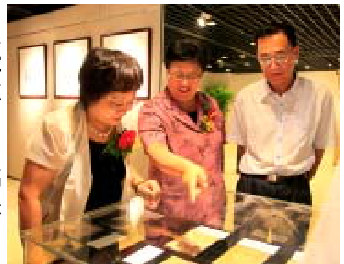
市、区领导欣赏上海老期刊创刊号

最后，中共上海市委宣传部副部长陈东，上海图书馆馆长、上海科学技术情报研究所所长吴建中，中共宝山区委书记斯福民，中共宝山区委副书记、区长汪泓，宝山区人大常委会主任张静共同为宝山区图书馆新馆启动开馆。