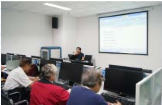
学员们仔细地记录老师的授课内容

近期，我馆组织开展读者免费培训之摄影基础培训班，本次培训班开始招募后，短短一周就有许多读者踊跃报名，最终共招收了18名学员，以中老年为主。