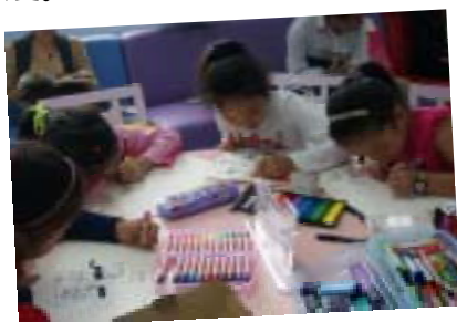
小读者专心致志地勾画出心中的祖国

2012年10月6日下午，我馆少儿阅览室里热闹非凡，“我为祖国而自豪”少儿现场绘画活动在这里举行。本次活动吸引了40多位小读者参加，孩子们纷纷用充满童真的绘画作品表达了对祖国的热爱。