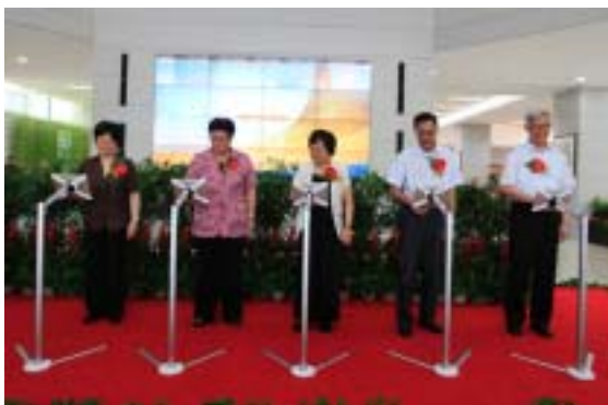
新馆开馆启动仪式