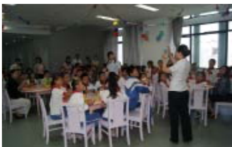
孩子们认真看老师演示

9月30日（中秋节）上午，宝山区图书馆四楼少儿阅览室里人头攒动，50多名来自全国各地的外来务工子弟及部分孩子家长兴致勃勃地相聚这里，与宝山儿童一起以沪上传统形式共度中秋佳节。图书馆工作人员还手把手地指导孩子们“折纸兔”，用拳拳爱心为他们送上“节日礼包”和真挚的祝福，带去节日的欢乐。