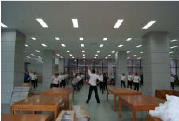
全馆员工认真学习分解动作

“第一节，热身运动，预备起……”听到这口号，再看看那一群身穿制服、认真做操的“同学们”，不禁让人怀疑是否误入了隔壁的学校。其实不然，这正是我们宝图员工在进行“每日一练”！