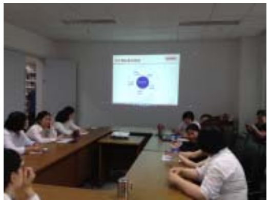
员工观看视频培训