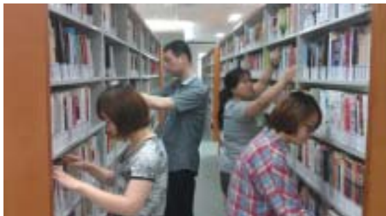
新同志认真理架排书

编者按：4月19日，我馆委托上海道伟人力资源服务有限公司进行公开招聘。经过公开报名、笔试、面试、体检、政审考察、公示等程序，共招聘8名项目用工。5月23日，8名同志正式报到并进行了岗前培训，现在已经和大家一起投入到新馆的工作中了。让我们看看他们对新工作的认识和心得吧。