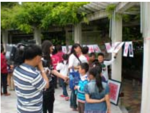
活动现场剪纸作品展示