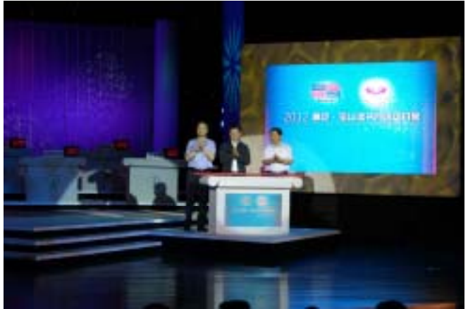
市、区领导共同启动宝山·嘉定读书月

上海市文广局副局长王小明先生，中共嘉定区委常委、宣传部部长林峻先生，中共宝山区委常委、宣传部部长杜松全先生共同启动了本次读书月活动。随后进行的以“诵读经典·传承文明”为主题的知识竞赛扣人心弦、精彩纷呈，来自两区六个街镇代表队现场进行了激烈的比拼。