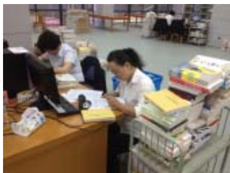
采编部的同志们在认真工作