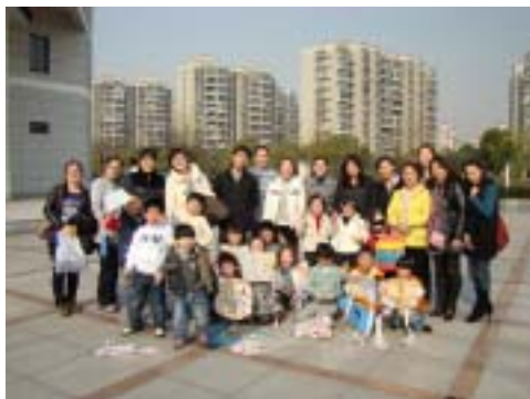
参加活动的小朋友和家长集体合影留念

2012年3月25日下午，近20个幼儿在家长陪同下，参加了我们庙行镇图书馆本年度亲子沙龙的首次活动。其间老朋友和新朋友们相互认识，积极互动。