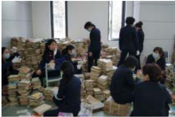
大家对旧书进行分类、剔旧工作