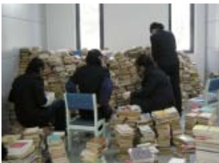
分拣搬迁过程中散乱的旧图书

新馆搬迁的过程就像蚂蚁搬家。相对于一堆堆的书山，我们就像是一个个勤劳的小兵蚁，每个人都按照自己的工作任务将一本本书分拣、归类，然后分别送往地下书库和各个楼层。虽然不知道后面还有多少的难题，但大家相信只要坚持不懈，发挥“小蚂蚁”的精神，六月底新馆一定会以最佳的状态迎接广大读者的到来。