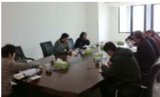
馆长就新馆情况向陶区长做综合汇报