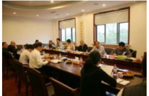
专家评估组在某街镇图书馆进行评审