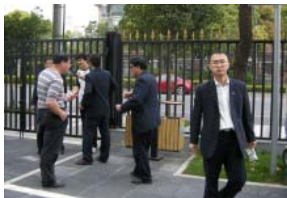
大家乘休息时间补充体力