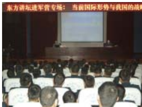
首场讲座活动现场

此次“2012东方讲坛进军营”系列专场讲座，不仅向驻沪海军和武警部队送上了一道丰盛的“文化大餐”，也进一步密切了图书馆与驻区部队的联系，进一步完善了图书馆的社会文化功能。（信息部 陆安）