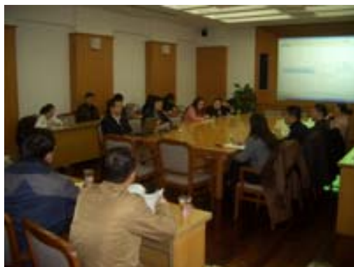
各区县图书馆相关技术人员在接受培训