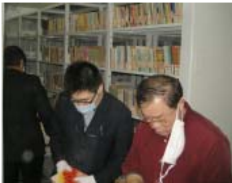
奋战在地下书库的男同胞们

在新馆挥汗如雨、却甘之如饴的我们，在新馆灰头土脸、却欢声笑语的我们，在新馆疲惫辛劳、却共同进退的我们，可以预见的，必定会在新馆开放以后，为我们宝图有史以来最好的新馆注入强大的活力和战斗力！