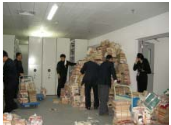
男同胞在地下书库对老旧图书进行上架、排架工作