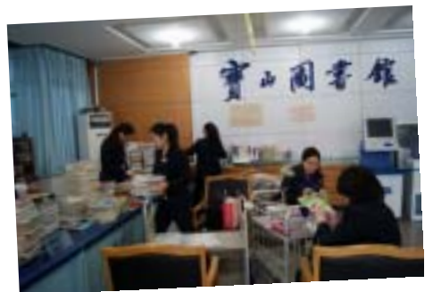
员工在更换图书书标