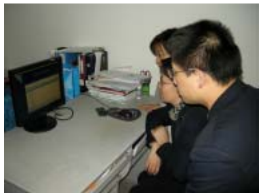
信息部职工观看视频讲座