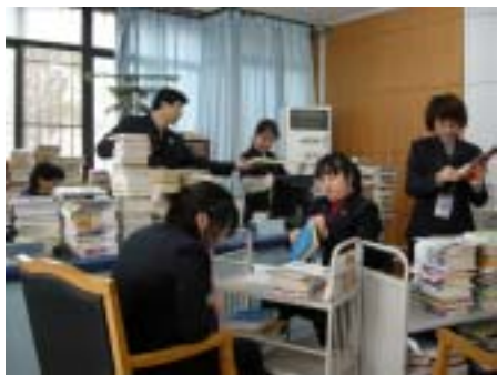
部分员工在更换图书书标