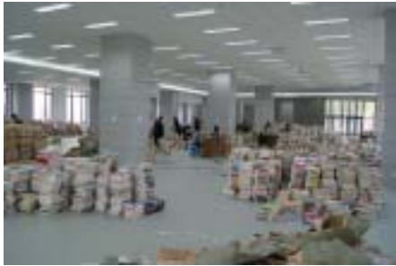
不断运抵的图书填满了整个一楼大厅

编者按：为了确保6月底宝山区图书馆新馆能以全新面貌与读者见面，目前我们正在进行紧张的开馆前的筹备工作：工作人员正在对馆藏的海量书籍进行人工整理、分类、贴芯片及上架……这是确保图书馆对外开放的重要环节。下面是我馆工作人员为新馆开放忙碌工作的场景。