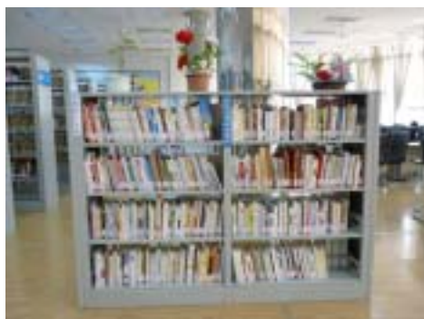
诗歌类特色图书专柜

顾村镇图书馆“诗歌类特色图书专柜”的设立和开放借阅，受到广大读者的热烈拥护，为顾村诗歌爱好者提供了一个学习和交流的平台，这对于顾村镇目前正在大力开展的创建特色文化“诗歌之乡”工作，努力继承和发展诗歌传统文化，具有十分积极的推动作用。