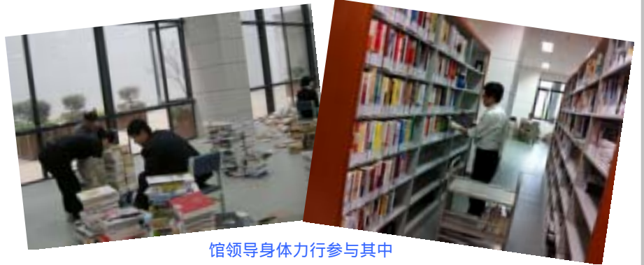
馆领导身体力行参与其中