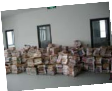
堆放在各个楼层的新书等待着二次分类和上架