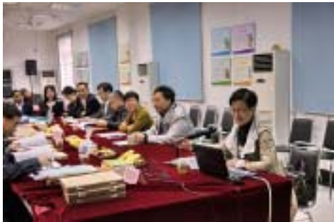
专家考评小组在进行评审