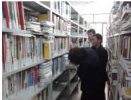
流通部工作人员在书库中统架

为解决日益增长的文献资源和有限的馆舍空间之间的矛盾，提高图书资源的利用率，保证正常的图书借阅秩序，缓解馆藏空间压力，近日，在流通部主任的带领下，我们这群新人开始了轰轰烈烈的“统架运动”。