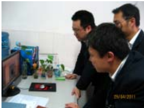
系统部职工观看视频讲座