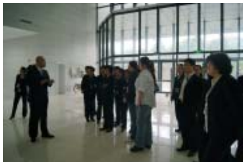
馆长在详细介绍新馆的功能和设施

根据馆长的介绍，新馆的服务设备集合了人性化、便捷化、高科技化的特点。馆内的书库、阅览室均设置有检索终端，无论读者走到哪儿，都可方便地利用检索工作站检索馆藏书目、利用馆内近100个的丰富数字资源。馆内的无线网络全覆盖，读者能够随时随地利用自己的手提电脑或手机上网冲浪。新馆还设置了读者预约的“九知堂”可作为自己的私密空间，进行不受外界干扰的学习研究活动，当然，此项服务也是完全免费的。