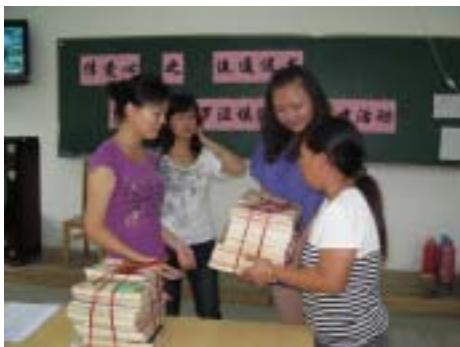
罗泾镇图书馆送书至阳光家园

此次共建活动，能让学员们在平时劳动、娱乐之余，进一步活跃思维，开拓视野，引导他们爱读书、读好书，培养崇尚读书的好习惯。