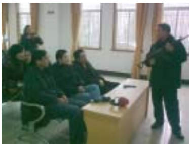
教官在进行理论讲解