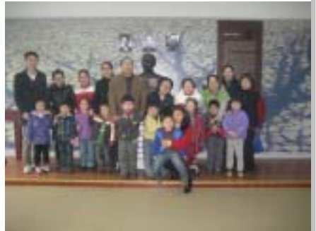
陈伯吹塑像前合影留念

2011年2月27日周日下午开展了第一次集体活动，孩子们在家长的陪同和带领下一同参观陈伯吹儿童文学创作基地，并且在陈伯吹塑像前合影留念。