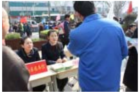
我馆志愿者开展现场咨询服务

三月初的早上寒风瑟瑟，大家学雷锋的热情却丝毫不受影响。早上八点半，广场上已经热火朝天，志愿者早已各就各位，为宝山市民提供最贴心的服务。