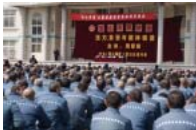
周家骥教授专题讲座

2011年3月17日下午，宝山市民讲座“健康人生”系列之“压力、紧张与精神调适”在宝山监狱举行。上海师范大学心理学系的周家骥教授对1700多位服刑人员进行了面对面的专题讲座。周教授主要研究方向为心理测验、心理干预与调适等，有着丰富的理论知识和教学经验。面对着这一群特殊的听众，周教授从有关紧张与压力的来源、心理