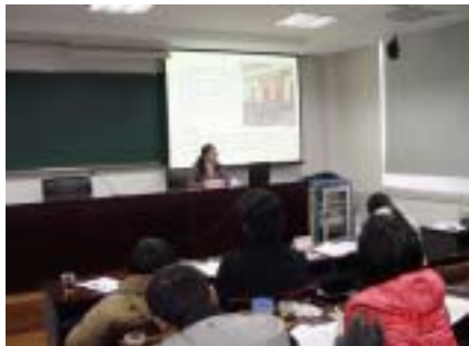
青年干部培训班老师授课现场

3月23日至3月25日，我在宝山区委党校参加了由宝山区文广局组织举办的青年干部培训班。在这次为期三天的培训中，我接受了“十七届五中全会精神解读”“理念信念教育”、“提升青年干部执行力”、“人际关系沟通方法与技巧”、“加强党性修养职业道德教育”、“践行科学发展观”、“建设宝山滨江新区”六堂课程的学习。通过党校老师理论联系实际，深入浅出同时不失幽默的授课，让我的政治理论素养、职业道德素质有了一定程度的提高，更新了我原有的陈旧观念及知识，让我受益匪浅。