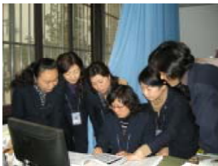
采编部的同事在探讨新版分类法