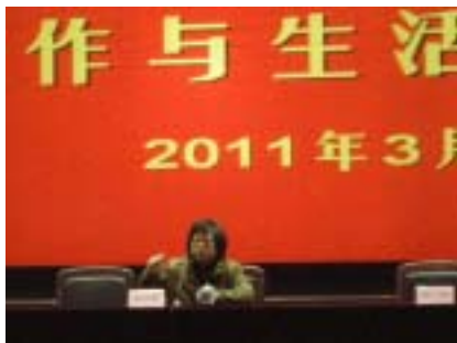
“三·八”节柏阿姨专题讲座