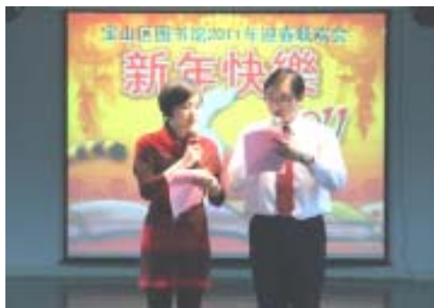
热情洋溢的主持人

热闹无比的趣味游戏让本次联欢会沉浸在一片笑声的海洋中。《齐心协力》中，全场动员，男女两队斗智斗勇，战成平局。《四项全能》中，团队精神得到了进一步发扬光大。馆领导集体参与的《公主救王子》表现出大家平日难得一见的领导们可爱的一面，更将迎新会和乐融融的气氛推向高潮。