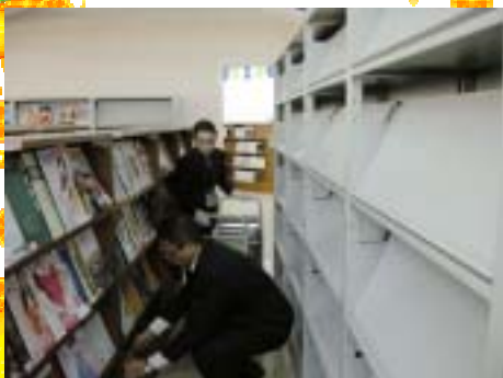
工作人员整理报刊架