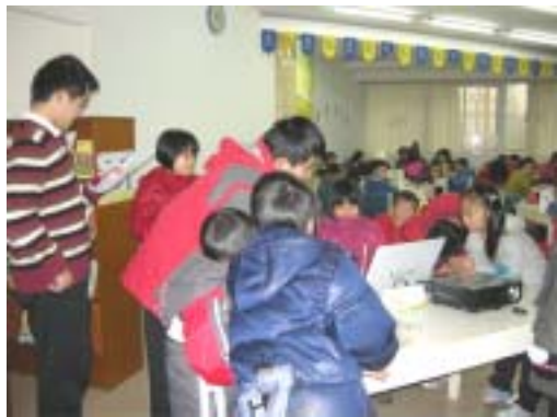
小朋友们在讨论故事的内容

2011年寒假又至，我馆为丰富广大少年儿童假期生活，精心打造了一系列丰富多彩的少儿活动。