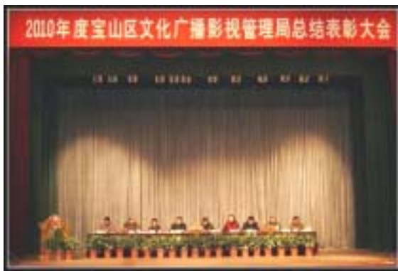
宝山区文广局2010年度总结表彰大会现场

2011年1月18日上午，2010年度宝山区文化广播影视管理局总结表彰大会在宝山区文化馆隆重召开。中共宝山区委常委、宣传部部长袁鹰，宝山区副区长李原出席会议并讲话。