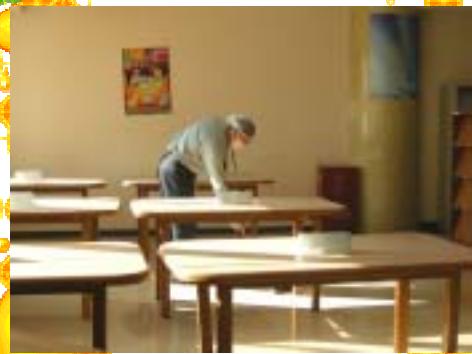
工作人员清扫报刊阅览室