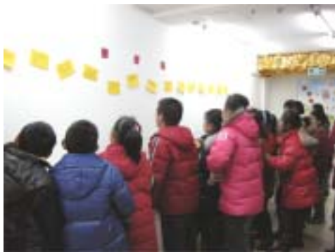
瞧，大家的认真劲儿！