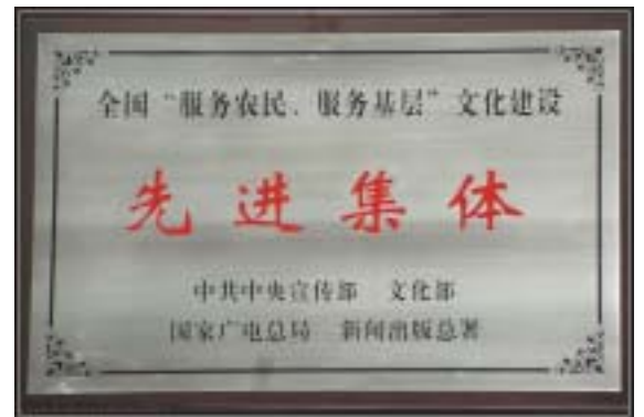
我馆荣获全国“服务农民、服务基层”文化建设先进集体