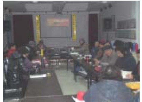
书友会成员正在交流发言

建设祖国多做贡献。活动最后，会长作总结发言时指出：我们老党员、老同志对毛主席都怀有深厚的感情，要牢记毛主席的伟大功绩和亲切教导，把这些宝贵的精神财富传承给下一代。