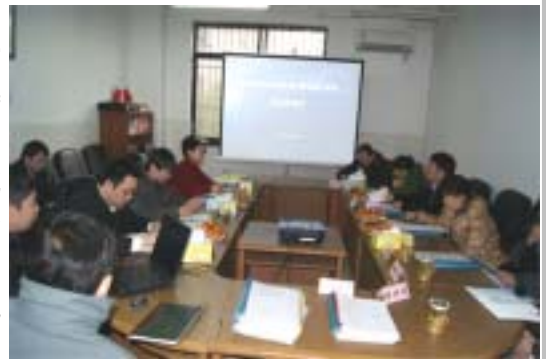
“借还通”系统项目验收会