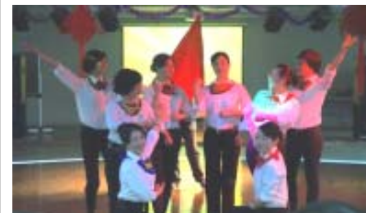
看，采编的娘子军们

整个联欢会精彩纷呈，高潮迭起。各部门职工争相献演，办公室的歌曲表演《精忠报国》，令人体会到新生代和老一辈相结合的力量；系统部的合唱《相亲相爱》，温馨而甜蜜；流通部的《军港之夜》，让大家想起我们最可爱的人；采编部的表演《红色娘子军》，使人真切体会到妇女能顶半边天；信息部的流行歌曲串烧，调动起全场的气氛；表演嘉宾吴刚的萨克斯独奏，余音缭绕。