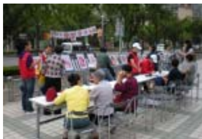
剪纸活动现场展示

目前，友谊剪纸这一绝活不仅在社区、学校、老干部活动中心得到了推广，还进入了绿色军营，在国际民间艺术节上也受到了外国友人的一致好评。为宏杨中华民族灿烂文化之瑰宝，得以源远流长，剪纸这一朵古老的民间之花将在友谊开得更为鲜艳美丽。（友谊路街道图书馆供稿）