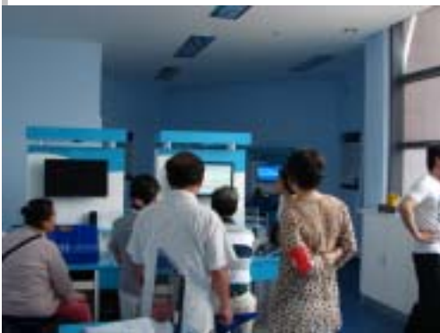
社区居民感受环保体验馆

环保体验馆中引进了美国威尼尔公司最新研制的数字化环保指标采集、分析仪器系统，社区居民们可借助电脑及上述仪器，以亲身参与的方式，便可将大家通常关心的，例如：大气污染度、饮用水质量、光磁辐射强度、噪音等级等环保数据精确无误的监测出来。其中数字式太阳能无限遥控气象站更是其中一道亮点，它可将庙行镇社区范围内的基本气象数据，例如：温度、湿度、雨量、风速、风向、太阳辐射、大气压力等随时精确地显示出来，并还可预报未来24小时内本社区的天气趋势。