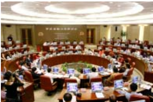
罗店龙船文化研讨会