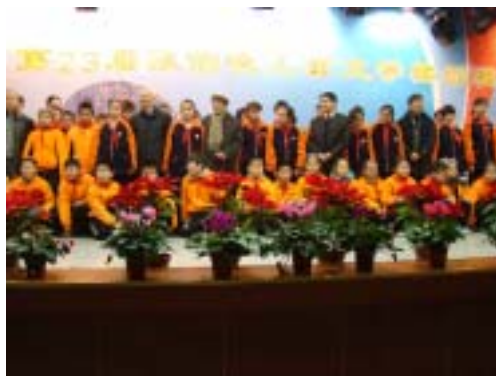
第23届陈伯吹儿童文学奖颁奖会

第24届陈伯吹儿童文学奖颁奖会也将落户庙行，庙行镇社区图书馆将继续以发扬陈伯吹先生的精神、促进儿童文学传播为宗旨，为开展各种儿童文学活动提供便利，为社区文化注入活力。