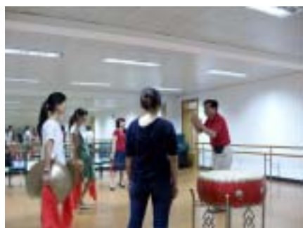
锣鼓队老师在授课中

为了使月浦锣鼓更好地在月浦地区传承和发展,月浦镇图书馆利用各种假期,定期邀请打击乐专家、著名鼓手为月浦镇居民进行锣鼓讲座和教学,并和月浦实验学校结为共建对象,在校内成立学生锣鼓表演队伍,由绛州鼓乐团的老师为学生讲课,教授传统锣鼓的演奏方法和技巧。该授课活动已经连续举办了3年,为月浦镇培养了不少青少年锣鼓手,深受广大师生的欢迎。