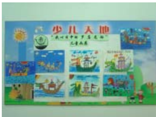
“我心目中的罗店龙船”儿童画展