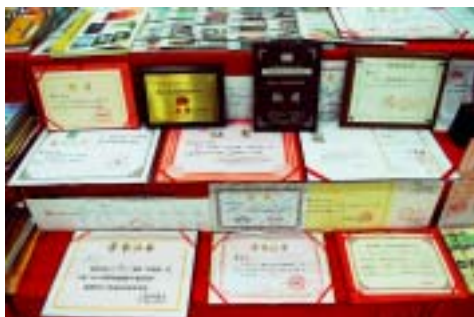
各类摄影大赛证书

淞南镇具有一定的群众摄影基础，1989年，宝山区首届摄影比赛，600多件作品参赛，淞南镇囊获摄影的一、二等奖。1993年6月，淞南撤乡建镇时，将群众摄影列为创建民间文化艺术之乡项目来抓，纳入了镇文化发展规划之中，在区摄影协会的关心下，选择了成熟的成员和单位作为镇民间文化艺术之