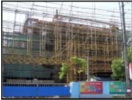
一座崭新的宝山中心图书馆正拔地而起

今天一上班就接到通知，说下午一点去新馆工地。听到这个消息，我忍不住回想起去年搬馆时的辛苦和一年来的期盼与憧憬。想着那个我工作了10多个春秋的图书馆一点点地被拆除，又一层层地被重新建起，而几个月后一座崭新的、现代化的图书馆将呈现在我们眼前，心里竟微微有些激动。