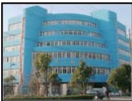
“昨日”的宝山区图书馆

相信一座崭新的图书馆是每个宝图人的心之所属；相信经过宝图人的共同努力，我们一定能为宝山市民营造一个更舒适的知识殿堂。 (信息部 王玉峰)