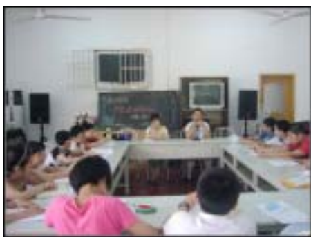
关工委的老同志与孩子们共读革命诗篇

2010年7月19日上午，淞南镇图书馆与九村一居委联合组织社区中小学生与关工委老同志开展了“老少结对，共读《热血写春秋》”读书活动。旨在利用我们身边老革命的丰富资源，对青少年进行革命传统及爱国主义教育。