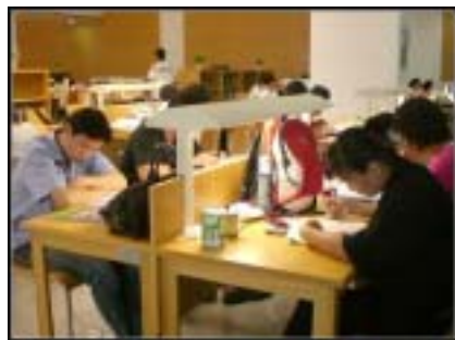
为每一位读者点亮的关爱之灯