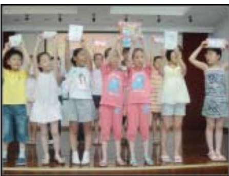
孩子们手举奖品个个欢呼雀跃

在图书馆老师和居委干部的组织下，小朋友们一个个依次走上舞台，首先作自我介绍，然后表演自己准备的诗歌朗诵节目。他们中有7、8周岁的低龄儿童，也有13、14周岁的初中学生。他们有的朗诵“我与上海世博同行”的新童谣和新儿歌，有的朗诵课本中学到的经典诗歌，整个活动过程中时不时地响起欢快的掌声。