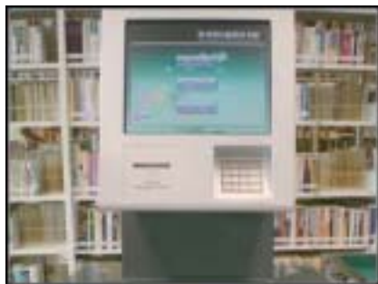
操作简单、使用方便的自助借还机