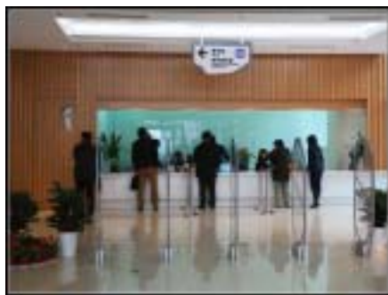
闵行区图书馆入口处的借还服务台