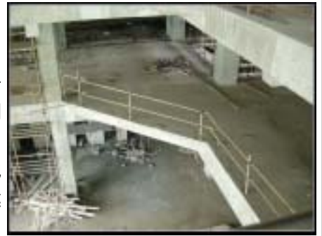
还有些凌乱的新馆内部一角

今天一上班就接到通知，说下午一点去新馆工地。听到这个消息，我忍不住回想起去年搬馆时的辛苦和一年来的期盼与憧憬。想着那个我工作了10多个春秋的图书馆一点点地被拆除，又一层层地被重新建起，而几个月后一座崭新的、现代化的图书馆将呈现在我们眼前，心里竟微微有些激动。