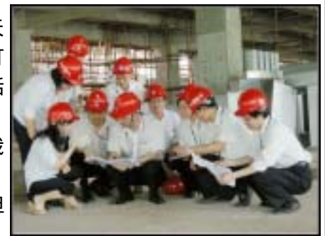
同志们正用心规划着宝图新馆的明天

那个在脑海中想象过无数次的新馆，就这样呈现在我们眼前了。当我们带上安全帽进入工地时，脚手架依然在，里面的钢筋铁骨也还看得到，地上到处堆着铁架子、水泥板等建筑材料。虽然一切还显得那么凌乱，但我们还是真实地感受到了我们的新馆。