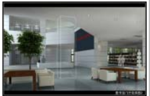
新馆门厅处效果图