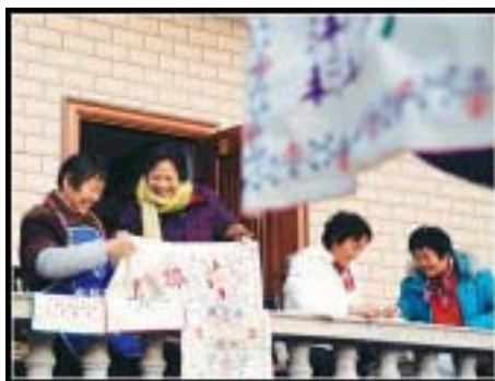
罗泾村民学习“十字挑花”手艺

在刺绣制作上，罗泾十字挑花看似简单，却要求颇高。既要求正面全部用十字形成花样，反面也要形成均匀点状，基本针法有“行针”、“绞针”、“蛇脱壳”等。罗泾十字挑花的图案，历经长期衍展，形成独特的表现程式，有着数十种独立纹样。