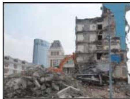
宝图旧馆在隆隆的机器声中逐渐消失