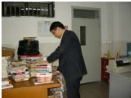
闭架图书的捆扎工作

作为直接面对读者的部门，流通部一直秉承着“关注读者·用心服务”的宗旨。就拿这次的书库整理来说，之所以选取文艺和少儿两大书库进行先期整理，主要考虑到两大原因：读者对文艺书库书籍更新的要求较高，文艺书入库量也较多；少儿小读者通常喜欢色彩鲜艳和形式多样的图书，因此我们对少儿书库的图书更新也比较快。在整个过程中，我们力求做到不影响读者的正常借阅活动，选择未开馆或者人流量较少的时间进行工作，虽然还是给读者带来了不便，但在广大热心读者的帮助和谅解下，基本达到了初期制定的工作目标。