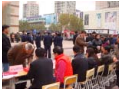
党员志愿者活动现场