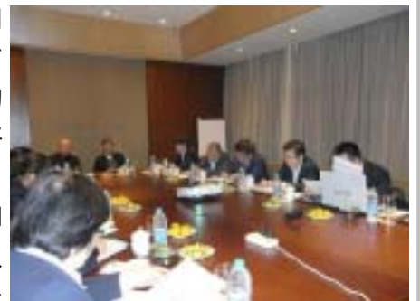
新馆工作务虚会现场

2010年10月26日，宝山区图书馆召开新馆工作务虚会，馆班子成员和中层干部就新馆开放前的各项准备工作、新馆的运作等进行集中探讨，从而让大家对当前我馆面临的形势有更加清醒的认识，以便把握趋势，少走弯路，提高效率。各部门分别就目前的工作分工和新馆岗位设置、工作流