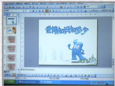
活动所用的多媒体幻灯片

问答题部分，又让小朋友真正认识到自己与世博会的关系，每个孩子都在努力思索如何从我做起、从自身做起，为世博会出一份力。此次活动，不少小朋友甚至家长都成为了积极的参与者，使得我们的“世博知识知多少”活动不仅热闹而且更有意义。