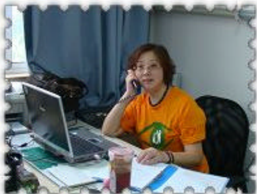
陈主任在忙碌地工作中

一个人的精力是有限的，但是为自己喜爱的事业投入的热情却可以是无限的。在2008年第六届上海宝