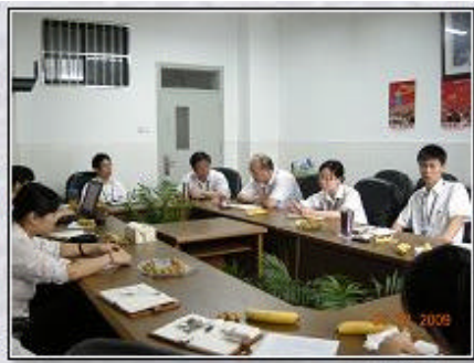
轮岗人员交流会现场

结语： 最后请允许我借用唐馆长的一句话作为结语：“轮岗交流的这一年时间，大家可以把它看作是人生旅途的一个车站，无论接下来是继续前行抑或回到原来的轨道，重要的是我们去充分感受这个探索的过程。”