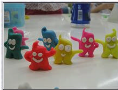
小朋友们制作的海宝

这天的活动非常成功，不仅小朋友们很开心很尽兴，我们蒲公英的成员们也觉得很收获颇丰。暑假的这次活动对我们这些还未踏上社会的大学生来说，不仅仅是一个为社区服务的机会，同样也是锻炼自己能力的机会。我们会继续努力，把每一次的活动都办得有声有色！