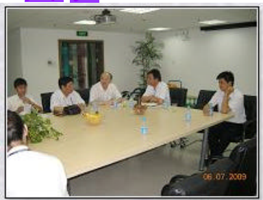
两馆领导在做工作交流

7月7日，我们宝山区图书馆一行数十人来到青浦区图书馆参观学习，此行目的主要有二：一级馆考评材料的整理工作和新馆建设的筹备工作。