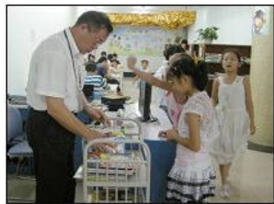
史依迅老师带病坚持工作

有句话说得好：“身体是革命的本钱！”希望大家也要关心自己的健康，必要时“轻伤也得下火线哦！”