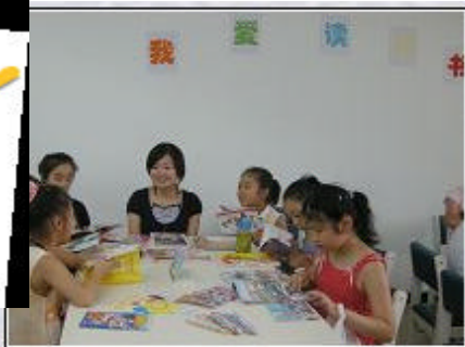
志愿者与小朋友在活动

气氛热烈，参赛泼墨，时而上自己的才艺。虽还稍嫌稚嫩，但努力的成果，每自己眼中世博园展现给大家看，