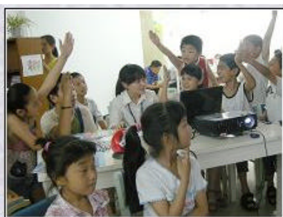
同学们争先恐后地回答问题

7月5日，第一期活动拉开了帷幕，阅览室里座无虚席，小朋友们热情高涨，积极地参与到我们的活动中来。