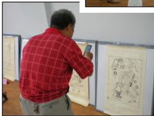
人们在作品前驻足观看