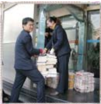
上图：男女搭配干活不累！

近段时间，我馆继地下书库顺利搬迁后，三楼的中心书库也开始了抽书捆书的工作。这次的工作主要是几天内抽选并捆扎一万册中心书库的书籍。由于时间较为紧迫，工作量比较大，需要较多的人力，在馆领导的动员下，一批没有参与过老馆搬迁的年轻同志们热情投入到了这项工作中。