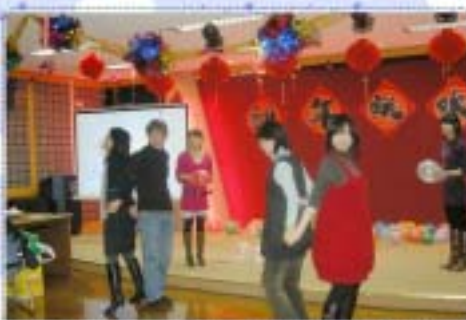
上图：局长和大肚子“局长”PK，爽！

中音为大家献唱一曲《祝福》。我们的游戏一个接一个，节目也一个接一个。采编部都是娘子军，别看她们平时默默无闻，但一有活动就是一支能歌善舞的团队，这次她们为大家演唱了《今夜无眠》，歌声载着舞蹈，精彩实足，让馆里那些