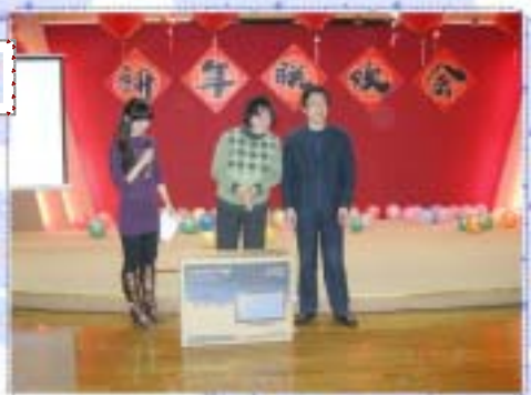
上图：真的是我中了头奖吗？ 页 3