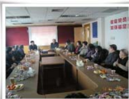
上图:馆领导与退休职工欢聚一堂