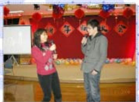
上图：金童玉女含情脉脉，羡煞人哦！

吃不容易”。这游戏就是把一块小巧巧克力放在眉心，不用手，只能用脸部表情，把巧克力吃到嘴里，别看领导们平日里严肃，但做起游戏来一点也不含糊，为了娱乐大家，三位领导摘掉眼镜，尽力按照主持人的要求完成动作。