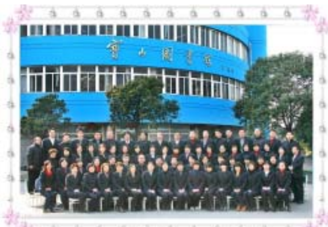
上图：宝山区图书馆职工“全家福”！