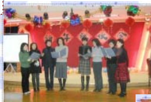
上图：柔情的音律，深情地演绎！

平日里，馆领导们为了图书馆建设大计日夜奔波，兢兢业业。趁联欢会之际，我们请他们也来轻松一下，让四位领导同台做游戏“好