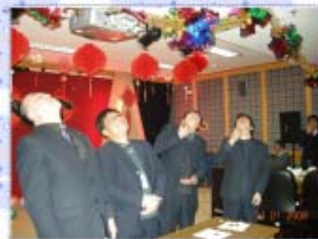
上图：咦？领导们怎么都一个姿态呢？

联欢会第一个节目“牛气冲天”，寓意在牛年里我们每一位同志都能开拓前进。在主持人的邀请下，馆里的“大小牛”一起上台，每一位都用他们的肢体语言向大家表示牛年的祝福，并从最老的属牛同志开始，每人说一句牛年祝福的话；从最小的牛开始，做一个“牛气冲天”的动作，夸张的动作和形象的表演，引得台下笑声阵阵。