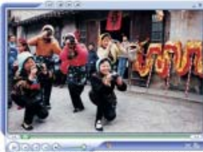
图为：高老师的摄影作品

高老师不仅是一名文艺爱好者，同时还是一名摄影爱好者，从1992年开始他就用手中的相机记录着社区改革的巨大变化，先后在《人民日报》、《中国摄影报》、《解放日报》、《文汇报》、《新民晚报》等发表摄影作品300多幅，《百岁老太喜迎新千年》荣获全国群众艺术摄影学会举办的“千年一瞬”摄影赛一等奖，同时还获得了上海市摄影家协会等举办的友谊商城杯“世纪之交”24小时即时摄影大赛特等奖，《新民晚报》还刊发了彩色摄影专版。2006年其摄影作品《乡村新苗》在日本世博会中国馆展出。2007年高老师代表淞南镇参加了美国洛城摄影联展、交流活动，美国《有线新闻网》报道其摄影作品。高老师还积极引导社区摄影活动的开展，1996年10月淞南镇艺术摄影在上海市美术馆举行；1999年承办了上海《风从乡间来》市郊摄影比赛等。（淞南镇图书馆）